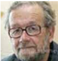
Κούβελας Ηλίας Ομ. Καθηγητής Ιατρικής Πανεπιστημίου Πατρών